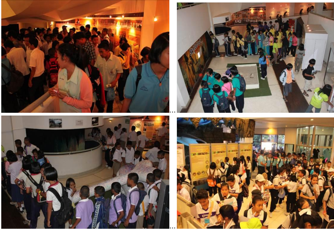
ภาพแสดงงานสัปดาห์วิทยาศาสตร์ ประจำปี 2555 ณ พิพิธภัณฑ์สถานธรรมชาติวิทยา ฯ

2 มีการจัดทำโครงการหลักสูตรนอกห้องเรียน ให้นักเรียนระดับมัธยมศึกษา เข้ามาเรียนรู้เนื้อหาที่เกี่ยวข้องกับหลักสูตรของกระทรวงศึกษาธิการ ผ่านนิทรรศการ และกิจกรรมที่พิพิธภัณฑ์ฯ จัดให้ ทำให้นักเรียนมีความเข้าใจเนื้อหามากขึ้น